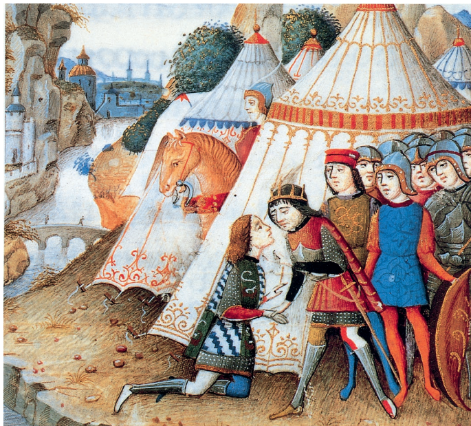
MINIATURA RAFFIGURANTE LA CERIMONIA PUBBLICA DELL'OMAGGIO DEL VASSALLO AL SIGNORE.