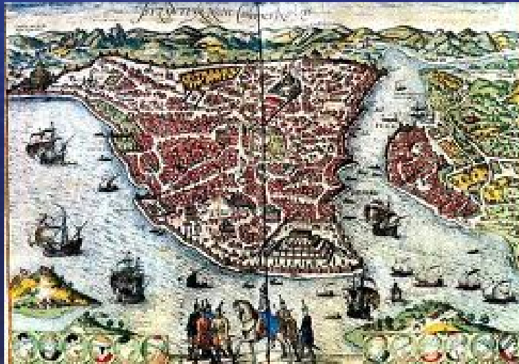
Cartina di Costantinopoli