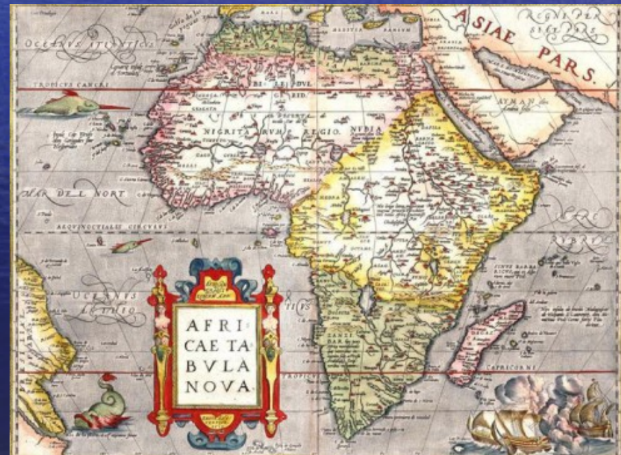
Mappa del 1570