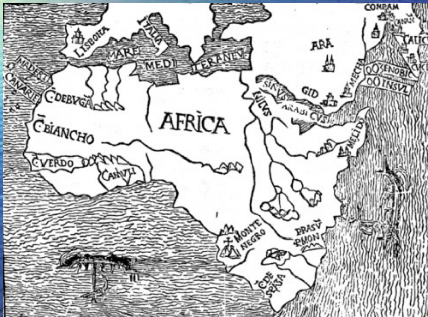
Mappa del 1508